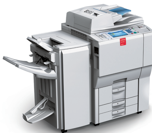
Un champion de la digitalisation des documents : Le Nashuatec MPC6000.