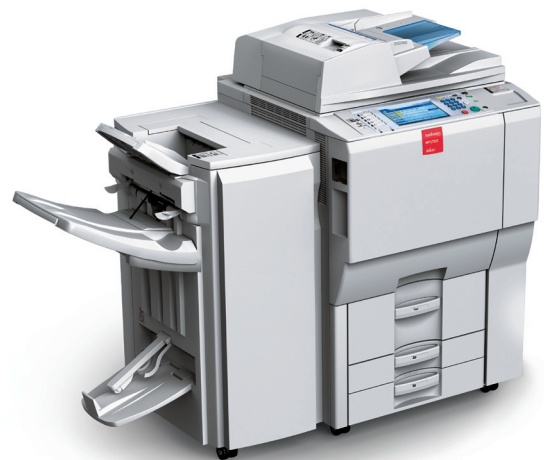
Ein Meister in der Digitalisierung von Dokumenten: Der Nashuatec MPC6000.

Zusätzlich zur zeitsparenden und Effizienz steigernden AutoScan optimierte die René Faigle mit PrinterSupplyMonitor (PSM) ebenfalls die Abläufe der Büromaschinenadministration. Diese Zusatz-Software kontrolliert von jedem mit dem Netzwerk verbundenen Gerät den Tonerstand, löst automatisch die Bestellung aus und übermittelt zum bestimmten Zeitpunkt den Zählerstand.