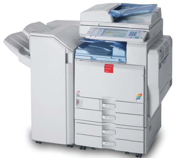
Das Multifunktionsgerät MPC 3500

Auf den Geräten bei Henauer Gugler werden von verschiedenen Mitarbeitern für die unterschiedlichsten Zwecke, Projekte und Kostenstellen gedruckt und kopiert. Die Produktionszahlen der einzelnen Maschinen für Farb- oder Schwarzweiss-Ausdrücke sind im Normalfall bekannt, es ist allerdings nicht ersichtlich, welcher Mitarbeiter die Dokumente produziert hat und schon gar nicht für welche Kostenstelle. Da man bei Henauer Gugler AG jedoch genau diese Daten benötigte, war eine praktikable, effiziente und bezahlbare Lösung gefragt, um diese Informationen zu erfassen und für die weitere Verarbeitung zur Verfügung zu stellen. Eine weitere wichtige Vorgabe war dabei, dass an allen fünf Standorten das gleiche System mit denselben Funktionen installiert wird.