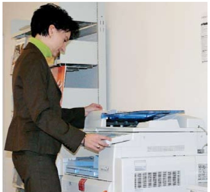
AutoStore et Nashuatec facilitent énormément le travail.

L'OIZ, en tant que prestataire du département des finances de la ville de Zürich, est l'interlocuteur privilégié pour toutes les questions concernant l'organisation et l'informatique, ainsi que le fournisseur central d'informatique dans l'administration zurichoise, et occupe plus de 200 employés. L'OIZ est responsable pour un nombre impressionnant d'environ 11'000 utilisateurs (dont 1'600 Citrix Clients). Elle se concentre sur le support informatique des processus organisationnels et le fonctionnement des moyens informatiques au sein de l'administration de la ville. De plus, l'OIZ se charge de toutes les tâches de coordination informatiques. De ces tâches, les standards et directives supérieurs sont dans l'intérêt d'une stratégie homogène pour tous les départements et domaines. Les prestations de l'OIZ ont un aspect très pratique, car les employés travaillent intensivement avec les clients, les fournisseurs, les conseillers externes ainsi que le domaine de la science. C'est ainsi qu'un savoir-faire est acquis, qui optimise la qualité, la sécurité, la fiabilité et le rapport qualité prix. L'OIZ répond entièrement aux besoins IT de sa clientèle avec ses produits et prestations.