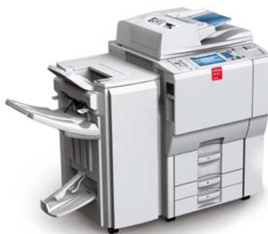
Un champion de la digitalisation des documents : Le Nashuatec MPC6000.