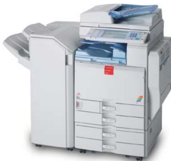
Le système multifonctionnel MPC 3500

Avec une grande expérience, la vision et la créativité renforcé avec succès Henauer Gugler SA construit depuis 1922. Aujourd'hui, leader indépendant Suisse comme bureau d'ingénieur du génie civil et bureau d'études, Henauer Gugler connaît tout sur la complexité de la construction. Grâce à des formations continués de plus de 130 collaborateurs répartis sans les filiales de Zurich, Berne, Lucerne, Zug et Schwyz ainsi qu'à une infrastructure technique, Henauer Gugler peut réaliser des projets de haute qualité et efficacement et à temps tout en respectant les délais.