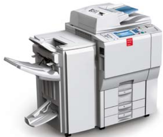
Ein Meister in der Digitalisierung von Dokumenten: Der Nashuatec MPC6000.

Zusätzlich zur zeitsparenden und Effizienz steigernden AutoScan optimierte die René Faigle mit PrinterSupplyMonitor (PSM) ebenfalls die Abläufe der Büromaschinenadministration. Diese Zusatz-Software kontrolliert von jedem mit dem Netzwerk verbundenen Gerät den Tonerstand, löst automatisch die Bestellung aus und übermittelt zum bestimmten Zeitpunkt den Zählerstand.