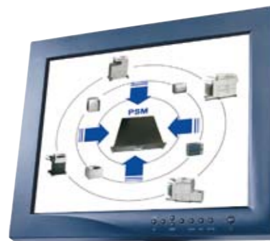
Print Supply Monitor PSM

tiquement du toner ou de transmettre à un moment spécifique les relevés de compteur de chaque machine reliée au réseau. Ce logiciel installé par Faigle est indépendant du fournisseur et peut aussi se charger de petites imprimantes de bureau. ●